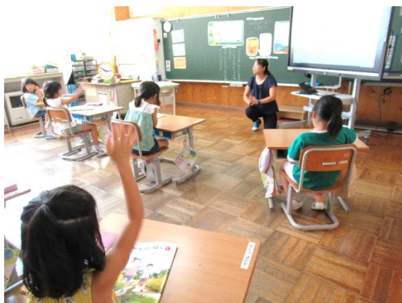
【1年・さるきちのいたずら】