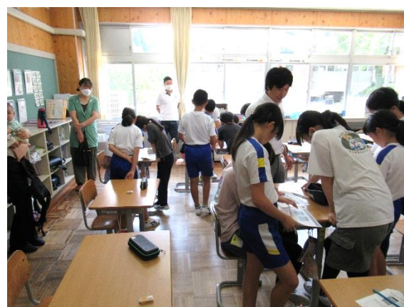
【5・6年・かいわのゆくえ】