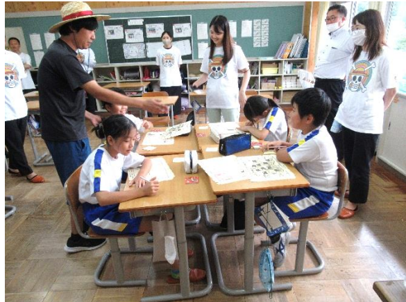
【グループ毎に、みんなでお互いのいいところを見つけ、教え合う】