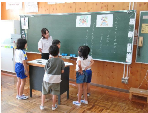
【2年・みんなのニュースがかり】