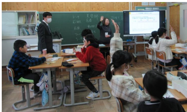
【わたしたちのまち出前講座】