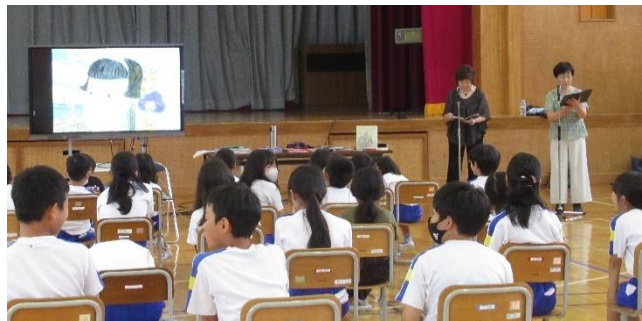
【アグリーダックス朗読鑑賞会】