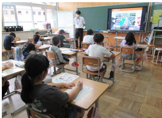
【福島県総合計画出前講座】