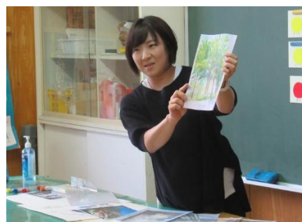
【星八千代先生による絵画指導】