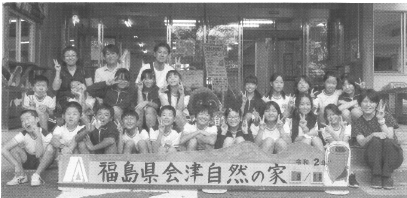
【みんな笑顔で・・・集合写真・・・写真を撮る直前にマスクを外しました】

この「自然体験学習」を実現するまでに、保護者の皆様方には、本当にお世話になりました。コロナウイルス感染予防を徹底した中での活動ではありましたが、子どもたちの心の中に、すてきな思い出ができましたこと、本当に嬉しく思います。これまでのご協力、ご支援に心から感謝申し上げます。