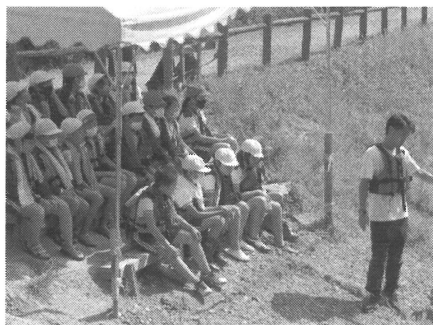
【カヌーの乗り方の説明を聞いて】