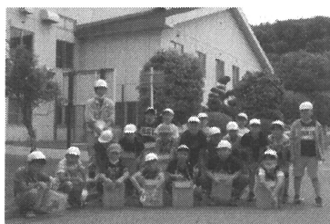
【クリーンセンター見学(4年)】