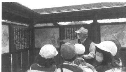
【旧榎原地区探検(3年)】

2学期は、8月25日(火)からです。また、一まわり大きくなった88名の子どもたちと会えることを楽しみにしています。充実した夏休みをお過ごしください。