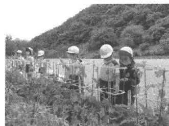
【大きく育てマイ朝顔(1年)】