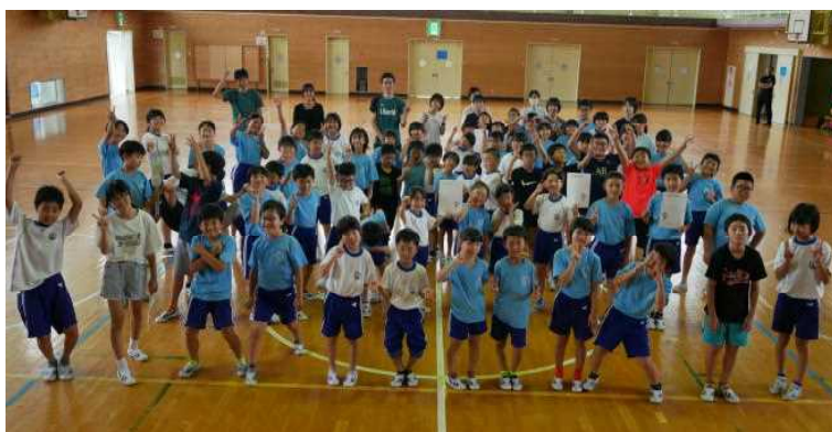
【旭田っ子タイムの後にみんなで1枚(7月17日)】

大きな声で挨拶や返事ができるように子、友達のことを考えて行動できるようになった子、自分の考えを分かりやすく話せるようになった子、上手に音読ができるようになった子、水泳でク